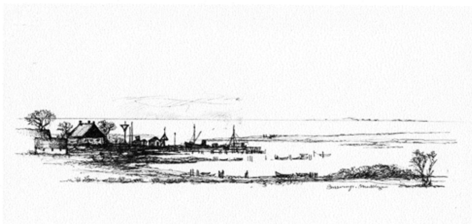
Udgivet af Bisserup Byting 2013 Tegninger: Mads Stage

Die letzte Sehenswürdigkeit, bevor man Skælskør erreicht, ist Schloss Borreby. Den ganzen Sommer hindurch sind hier wechselnde Kunstausstellungen zu sehen.